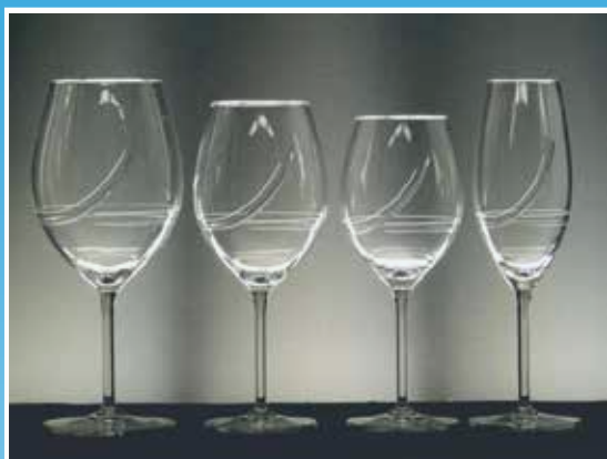
Talla de Cristal