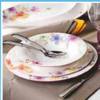
Mesa y Decoración del Hogar