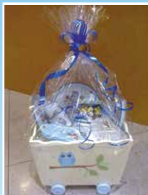
Artículos de Regalo Infantil

Haz tus Regalos desde: www.tadeval.com info@tadeval.com